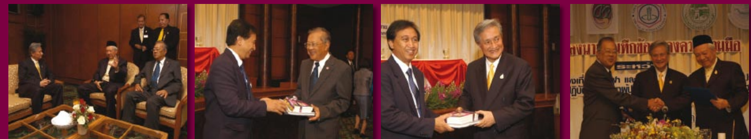
ร้อยโทสุวิทย์ ยอดมณี รัฐมนตรีว่าการกระทรวงการท่องเที่ยวและกีฬา เป็นประธานพิธีลงนามบันทึกข้อตกลงความร่วมมือระหว่าง กระทรวงการท่องเที่ยวและกีฬา และคณะกรรมการอิสลามแห่งประเทศไทย ในการพัฒนาผู้ประกอบการท่องเที่ยวกับมาตรฐานฮาลาล ณ ห้องเจ้าพระยาบอลรูม โรงแรมเจ้าพระยาปาร์ค กรุงเทพฯ (24 สิงหาคม 2550)