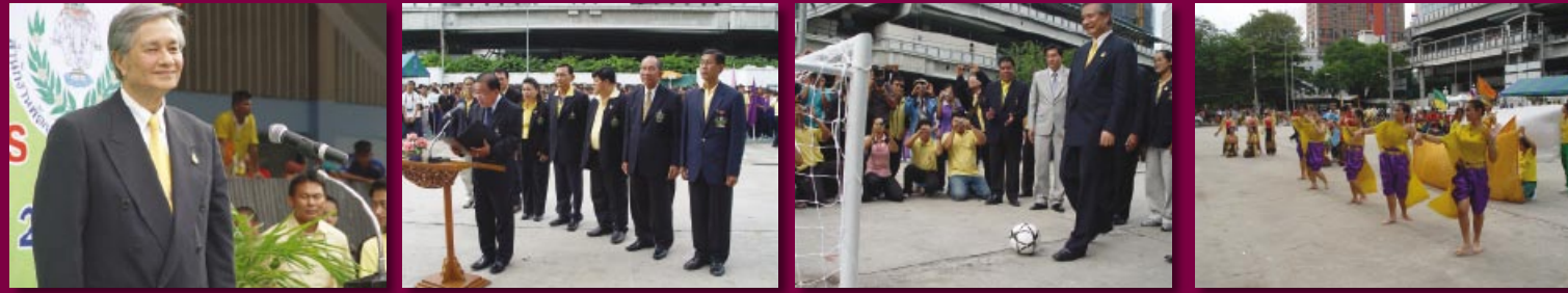
ร้อยโทสุวิทย์ ยอดมณี รัฐมนตรีว่าการกระทรวงการท่องเที่ยวและกีฬา เป็นประธานในพิธีเปิดการแข่งขันกีฬานักเรียนคนพิการระหว่างโรงเรียนประจำปี 2550 ณ อาคารนิมิบุตร สนามกีฬาแห่งชาติ ปทุมวัน กรุงเทพฯ (4 กันยายน 2550)