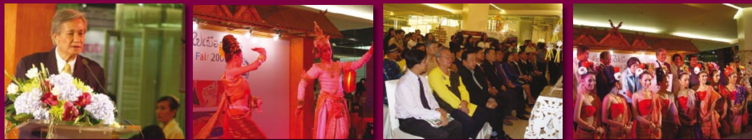
ร้อยโทสุวิทย์ ยอดมณี รัฐมนตรีว่าการกระทรวงการท่องเที่ยวและกีฬา เป็นประธานพิธีแถลงข่าวงานไทยเที่ยวไทย ไปเมืองเหนือ" ณ Living Hall ชั้น 3 ศูนย์การค้าสยามพารากอน กรุงเทพฯ (31 สิงหาคม 2550)