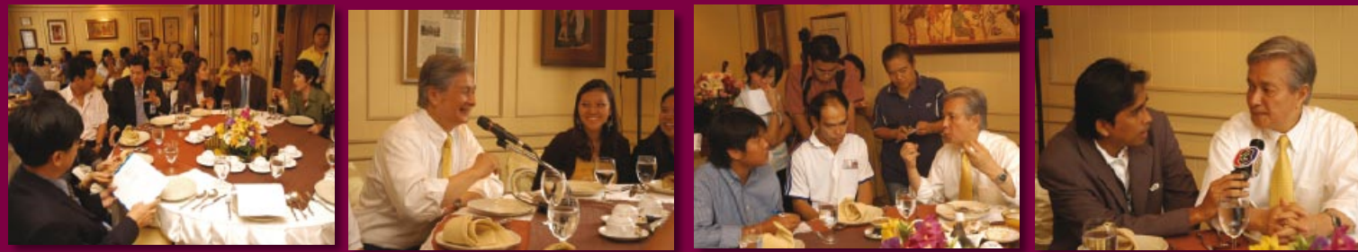
ร้อยโทสุวิทย์ ยอดมณี รัฐมนตรีว่าการกระทรวงการท่องเที่ยวและกีฬา จัดงานเลี้ยงขอบคุณสื่อมวลชนสายท่องเที่ยวและกีฬาและแถลงข่าวผลการดำเนินงานของกระทรวงการท่องเที่ยวและกีฬา ในรอบปี 49-50 ณ โรงแรมสยามซิตี กรุงเทพฯ (31 สิงหาคม 2550)