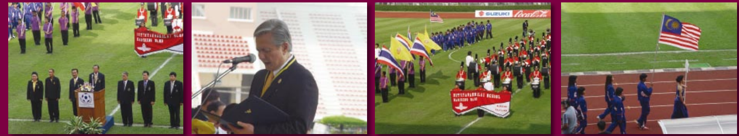
ร้อยโทสุวิทย์ ยอดมณี รัฐมนตรีว่าการกระทรวงการท่องเที่ยวและกีฬา เป็นประธานพิธีเปิดการแข่งขันฟุตบอลนักเรียนชิงชนะเลิศแห่งเอเชีย ครั้งที่ 35 ณ สนามศุภชลาศัย ปทุมวัน กรุงเทพฯ (28 สิงหาคม 2550)