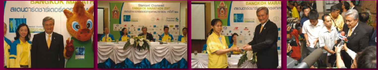
ร้อยโทสุวิทย์ ยอดมณี รัฐมนตรีว่าการกระทรวงการท่องเที่ยวและกีฬา เป็นประธานการแถลงข่าวสแตนด์บายมาราธอน ครั้งที่ 20 ณ บริเวณห้องโถง ชั้น 2 กระทรวงการท่องเที่ยวและกีฬา ถนนราชดำเนินนอก กรุงเทพฯ (28 สิงหาคม 2550)