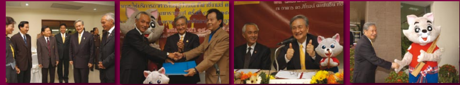
ร้อยโทสุวิทย์ ยอดมณี รัฐมนตรีว่าการกระทรวงการท่องเที่ยวและกีฬา เป็นประธานพิธีลงนามสัญญาให้บริการอาหารภายในหมู่บ้านนักกีฬาการจัดการแข่งขันกีฬาซีเกมส์ ครั้งที่ 24 และกีฬาอาเซียนพาราเกมส์ ครั้งที่ 4 พ.ศ.2550 ระหว่างฝ่ายที่พักและอาหาร กับมหาวิทยาลัยราชภัฏสวนดุสิต ณ อาคาร ดร. คีโรจน์ ผลพันธิน ห้อง 301 มหาวิทยาลัยราชภัฏสวนดุสิต กรุงเทพฯ (24 สิงหาคม 2550)