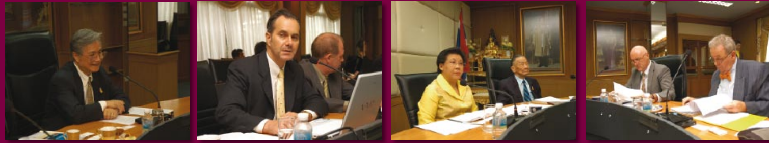
ร้อยโท สุวิทย์ ยอดมณี รัฐมนตรีว่าการกระทรวงการท่องเที่ยวและกีฬา ให้การต้อนรับคณะกรรมการบริหารสมาคมส่งเสริมการท่องเที่ยวภูมิภาคเอเชียแปซิฟิก (Pacific Asia Travel Association - PATA) เกี่ยวกับการพัฒนาปรับปรุงด้านการบริการและสิ่งอำนวยความสะดวกแก่นักท่องเที่ยวต่างชาติ ณ ห้องประชุม 1 ชั้น 2 กระทรวงการท่องเที่ยวและกีฬา ราชดำเนินนอก กรุงเทพฯ (3 กันยายน 2550)